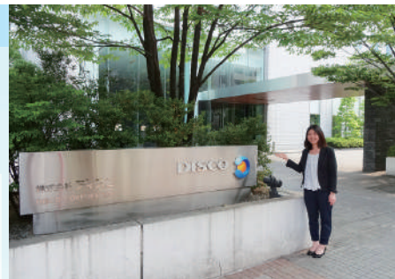
東京・大田区にあるディスコ様本社

私たちの生活に欠かせないデジタル製品の進化に、ディスコ様の製品・技術が貢献されています。