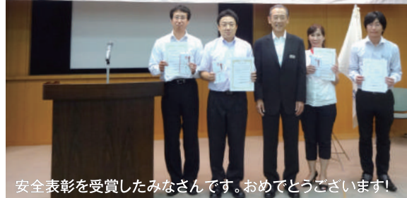
安全表彰を受賞したみなさんです。おめでとうございます!