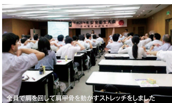
全員で肩を回して肩甲骨を動かすストレッチをしました