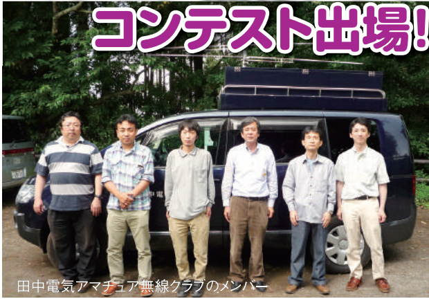
田中電気アマチュア無線クラブのメンバー

7月5日(土)21:00~6日(日)15:00に開催された第44回6m AND DOWN コンテストに出場しました。この大会は、一定時間内にどれだけ多くの局と交信できるかを競います。