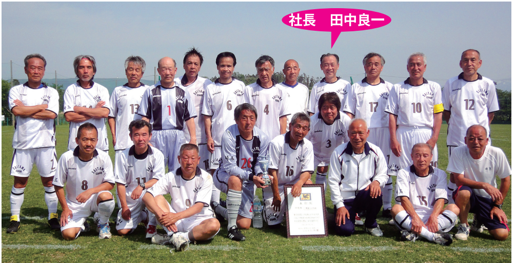
▲埼玉県代表チーム「埼玉シニア60」のメンバー