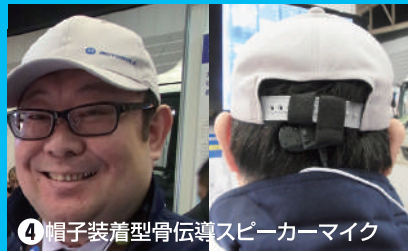
④ 帽子装着型骨伝導スピーカーマイク