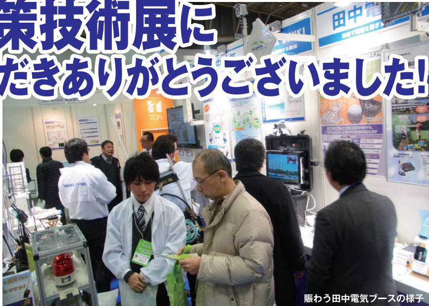
賑わう田中電気ブースの様子

2月7(木)、8日(金)パシフィコ横浜にて開催された第17回「震災対策技術展」に出展いたしました。先月号のファクトリーニュースでもご紹介しました震災時に非常に有効な MCA 無線の他に、地震速報システムや可搬型テレビ会議等を展示いたしました。今回もたくさんのお客様にご来場いただき、中には福島県や高知県の方がいらっやって、防災用の無線システムのお話を熱心に聞かれていました。