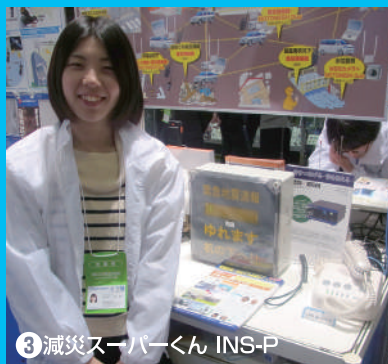
③ 減災スーパーくん INS-P