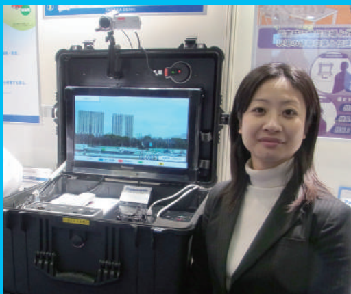
① Uメット スタートセット