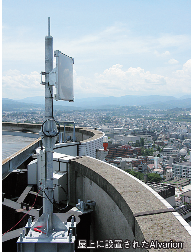
屋上に設置されたAlvarion

金沢市にある北國新聞社本社と、約14km離れた白山市にある印刷工場を、5GHz帯無線アクセスシステム「Alvarion B&B」で繋ぎ、 無線を利用した社内LANシステム を構築しました!