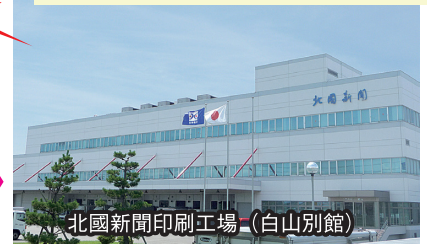
北國新聞印刷工場(白山別館)

「北國新聞」の朝刊普及率は県内で約7割を占めていて、今年で創刊119年を迎えられました。