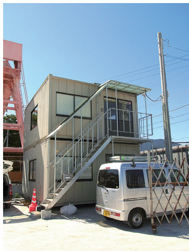
▲田中電気の現地事務所