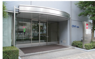
こちらのビルの中にTOAさんの東京事務所があります。

木場にあるTOA株式会社様の東京事務所にお邪魔してきました!神戸市に本社があり、78年前から業務用音響を、30年前から防犯カメラなどのセキュリティー分野も手掛け、音と映像の両面から社会の「安心・安全」に貢献されています!