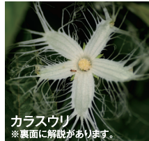
カラスウリ ※裏面に解説があります。