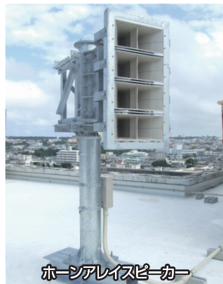
ホーンアレイスピーカー

『ホーンアレイスピーカー』は従来型の屋外スピーカーより2～3倍遠くへ音が届き、近くても遠くても明瞭に聞き取ることができます!ホーンアレイは、TOAさんの神戸本社が阪神淡路大震災で被災した経験を元に2008年に開発されました。東日本大震災以降、社会的注目度が増し、全国の自治体から問い合わせが増えている商品です。