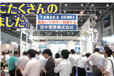
▲ブースは終日お客様で賑わっていました。

7月11日(水)~13日(金)の3日間、東京ビッグ サイトで開催された危機管理・災害対策の専門 展「オフィス防災EXPO」に今年も出展いた しました。昨年より、ブースを2倍に拡大し、多数 のお客様にご来場いただきました。おかげさまで 盛況に終えることができました。たくさんの ご来場を誠にありがとうございました。