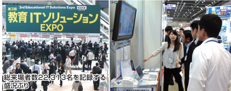
総来場者数22,313名を記録する盛況ぶり

われわれ田中電気は、災害対策ゾーンで学校向けの災害対策として無線機や無線システムをご案内させていただきました。災害時のキャンパス間の通信システムや、行事やイベントでの通信に役立つ無線機に、ご興味を持っていただきました。ご来場を誠にありがとうございました!