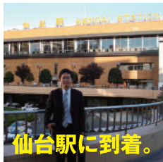
車で約10分のところに東北営業所があります。

東北営業所 〒984-0052 宮城県仙台市 若林区連坊2丁目9番26号 タンノ・ハイツB101 電話 (022)-292-5886