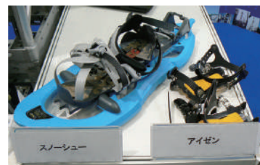
スノーシューとアイゼン