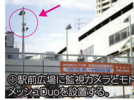
①駅前広場に監視カメラとモトメッシュDuoを設置する。

10月17日~28日まで相模原市橋本駅南口駅前広場で行われた「橋本駅南口スイスイ作戦」に、われわれ田中電気は参加しました。橋本駅の駅前広場では、停留所からあふれたタクシーが近くの道路に駐車してしまい、そこを通過する他の車との行き来で危険な状態でした。そこで今回、 モトメッシュDuo を使って交通社会実験が行われました!