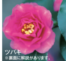
ツバキ ※裏面に解説があります。