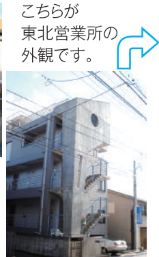
こちらが東北営業所の外観です。