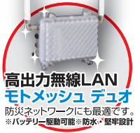
高出力無線LANモトメッシュDuo 防災ネットワークにも最適です。 ※バッテリー駆動可能・防水・塩害設計

5GHz帯無線LANモトメッシュDuo によって、駅前広場の監視カメラと1km離れた待機場所のモニターをつなぎ、ライブ映像で確認することで車を円滑に回すことを実現しました! タクシーのドライバーさんからは、「このまま続けてほしい」との声も聞くことができました。