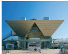
←東京国際展示場(東京ビッグサイト) ※イメージ