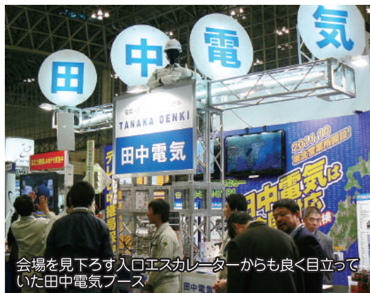
会場を見下ろす入口エスカレーターからも良く目立っていた田中電気ブース