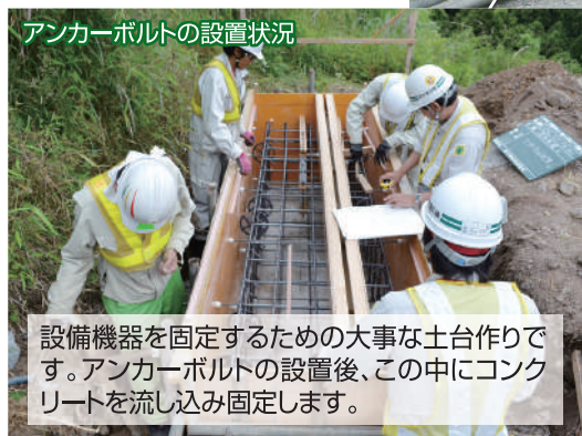
アンカーボルトの設置状況

●CCTVとはClosed Circuit Television(閉回路テレビジョン)の略です。特定の人が離れた場所の様子を監視するために映像を見るシステムのことです。本線や合流箇所での道路状況を管制センターで常時監視して道路情報板への発信や管理隊出動をします。