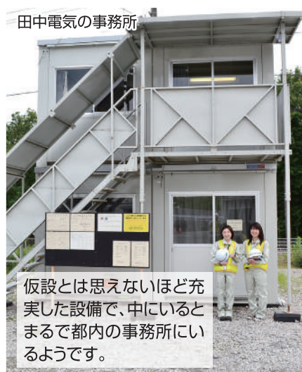
田中電気の事務所

仮設とは思えないほど充実した設備で、中に入るとまるで都内の事務所にいるようです。