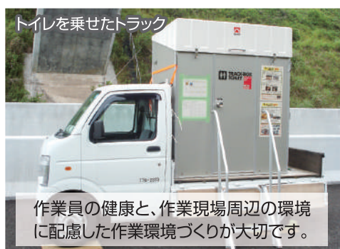
トイレを乗せたトラック

設備機器を固定するための大事な土台作りです。アンカーボルトの設置後、この中にコンクリートを流し込み固定します。