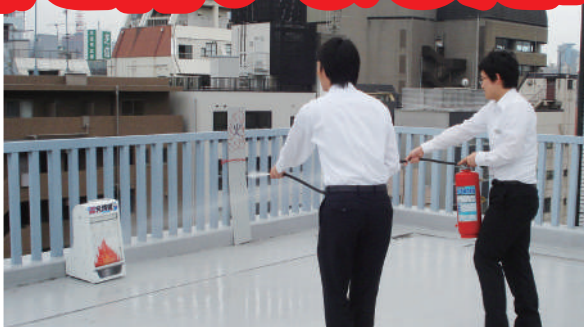
消火器:消火器を放射しながら「火事だー!火事だー!」と大きな声で叫び、少しずつ火の元へ近づいて消火することがポイントです。

毎年ビル全体で行います。今回は田中電気の給湯室から火が発生したという想定で行われました。田中電気本社8Fから非常階段を使って1Fまで避難しました。かかった時間は約5分!速やかに避難することができました。