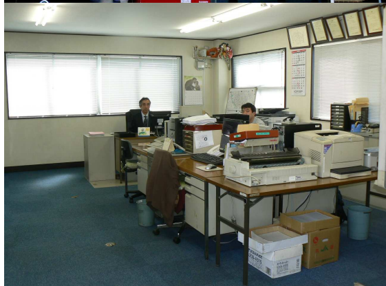
高円寺本社ビル。1Fはサービス部門

東京機器ホームページ http://www.tanaka-denki.co.jp/tokyokiki/top.html