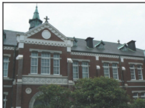
竹橋の奥に見えるのが皇居。江戸城本丸があった(写真上) 国立近代美術館工芸館は入館料200円。月曜休み(写真下右側)

地下鉄東西線の竹橋駅を出ると目の前にある。昔、竹で編まれた橋があったからといわれる。明治11年(1878年)竹橋門内に駐屯する近衛歩兵第一大隊の下士官と兵士ら260人が反乱を起こした。西南戦争の論功行賞に不満を抱いたのが原因という。