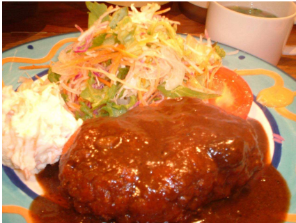
特製メンチカツドミグラスソース掛け ¥1,100