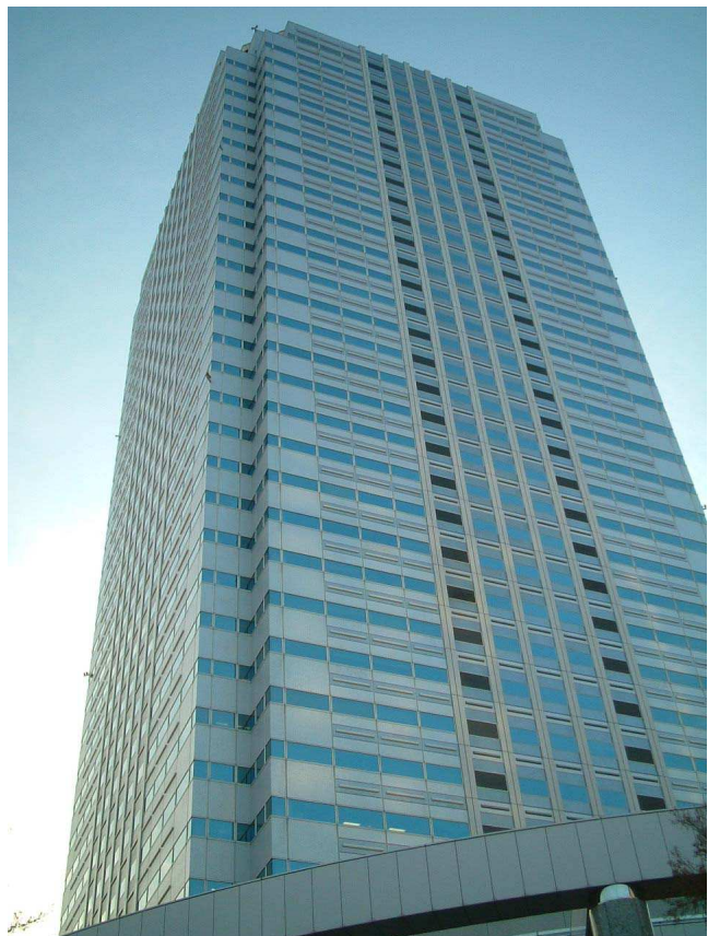
東京湾を一望できるビルの27階が本社です