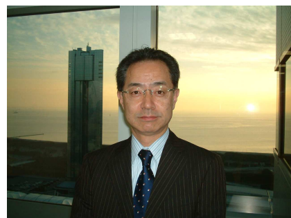
㈱ベイエフエム 上笠技術局長兼業務局長