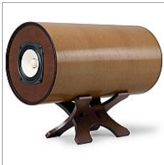
MS1001 ¥126,000 (税込)

開発から2年、先日発売された雑誌『SLOW』厳選世界のスピーカー60ブランドの中的一个にも選ばれました。