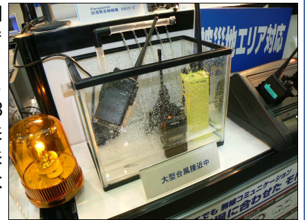
台風などで水に濡れても安心です

展示会全体としても2日間の合計で10,083名(前回9,103名)の来場者を迎え、開催以来初めて1万名を超え、大盛況でした。