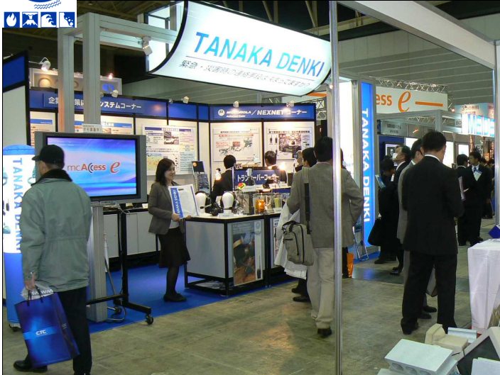
この春新発売「GL2500R」など人気の新製品を取り揃えた当社のブースにも約300名のお客様にご来場いただきました

2/1(木)～2(金)パシフィコ横浜で開催され、今回で2回目の出展となる当社ブースもかなりの気合を入れて臨みました。