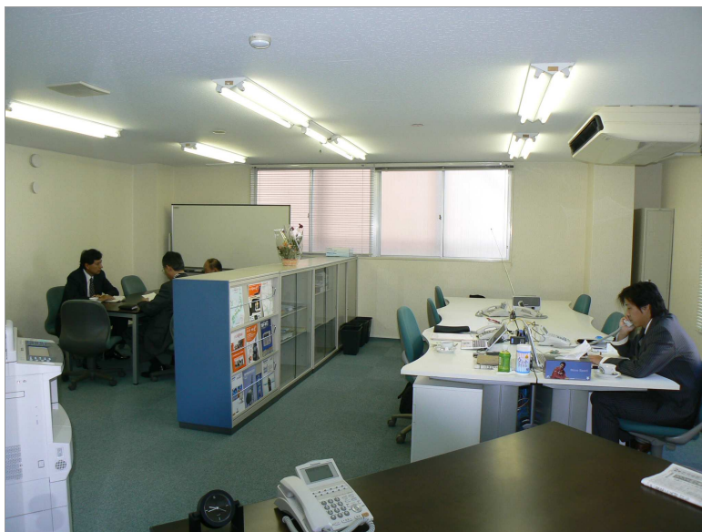
新設した関西支店。『お客様に応援していただけるよう がんばって参ります』（関西支店担当 秋山 写真右）