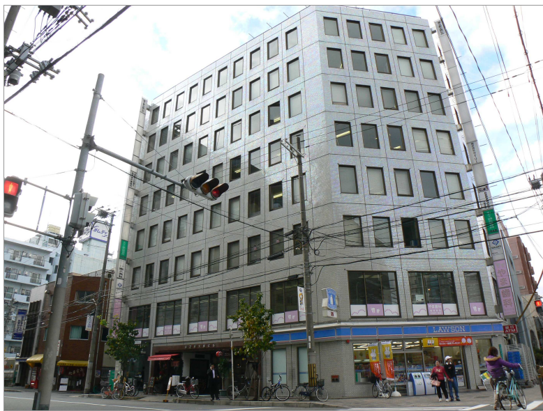
大阪府大阪市淀川区西中島 第2新大阪ビル4F TEL 06-4805-8070