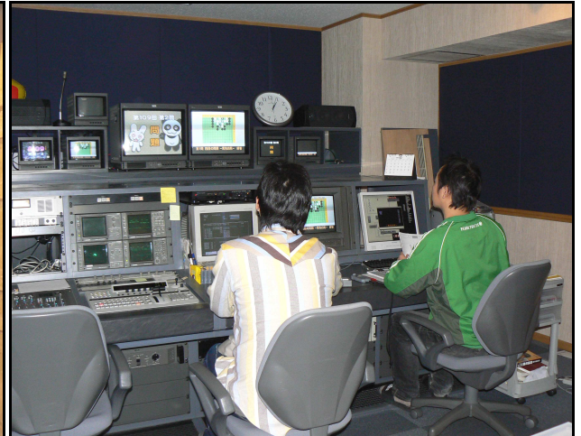
編集室。スタジオで撮影した映像と音声を編集中