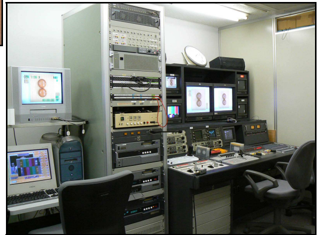
スタジオサブ。こちらで、ディレクターからカメラの指示が出され、切り替えられます。たくさんのモニターと、様々な機器でVTRに収録されます。

日本初の囲碁と将棋の専門チャンネル『囲碁・将棋チャンネル』を制作編集しているサテライトカルチャージャパン様を訪問しました。通信衛星を利用し番組を供給、ケーブルテレビ、スカパーパーフェクトTV!などで410万世帯に配信しています。