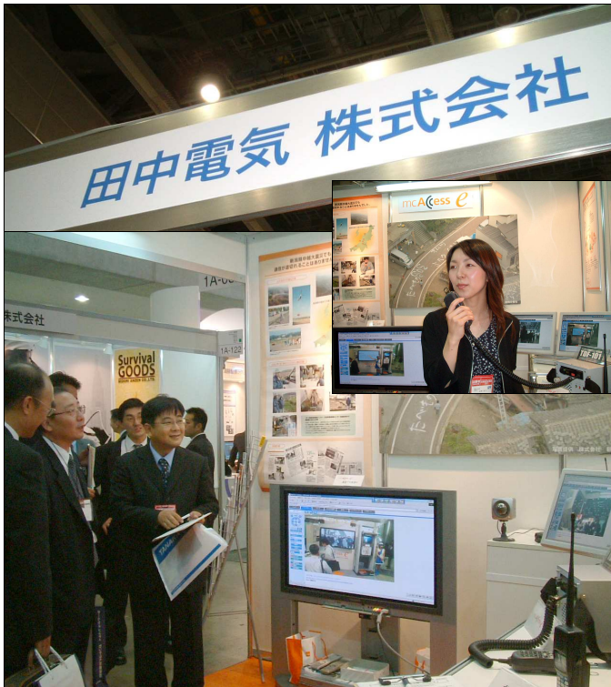
昨年出展した危機管理産業展2005の様子