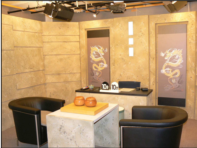
リニューアルされたばかりの対局室。 天井には碁盤を写すカメラが設置されています