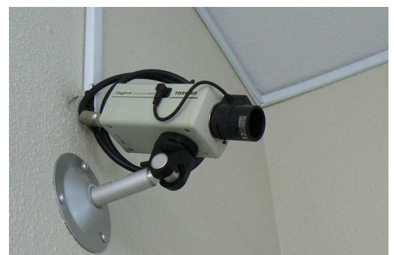
入退館者すべてをカメラ(写真上)が監視し、レコーダー(写真下)にしっかりと記録される

昨年10月には熊谷工場を全面的にリニューアルされました。（写真左） 着物や陶器など、高級感のあるものの印刷には特に自信があるとのこと。