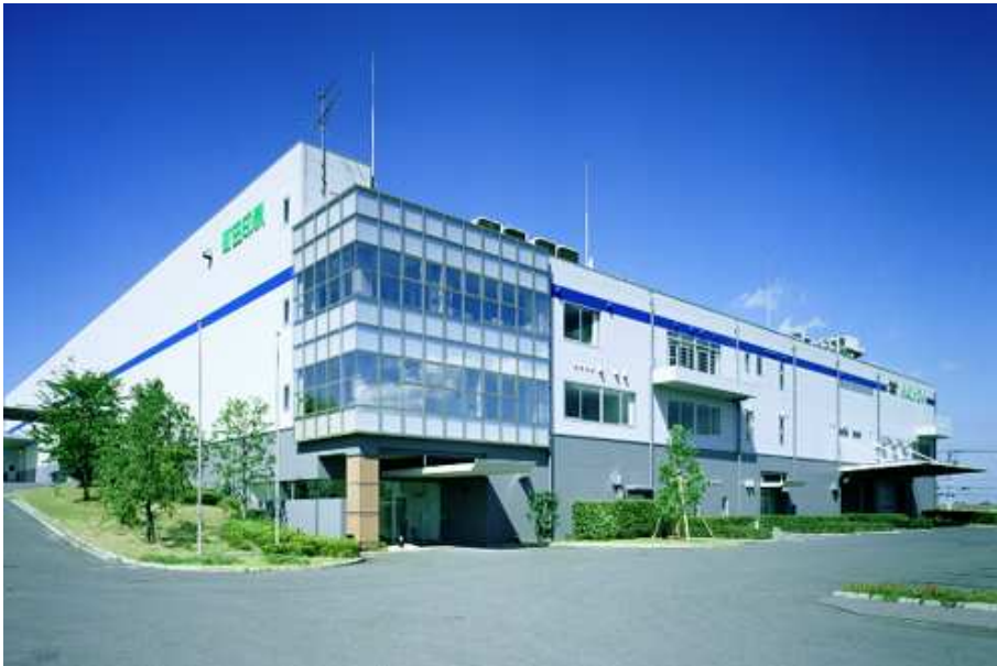
昨年10月に全面的にリニューアルされた町田印刷熊谷工場（写真上下） 環境重視の点でも業界でトップレベルです