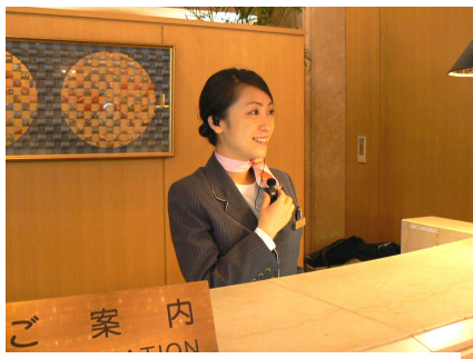
無線で連絡を取る担当者

当初は館内呼び出し装置(パナコール)を主に納めさせていただき、現在は業務の連絡用として簡易無線機も使用していただいております。