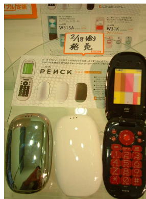
au新製品PENCK(ペンク) 個性的なデザインで人気