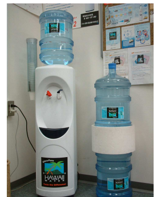
高さ1m×幅32cm×奥行37.5cm ボトルを入れた状態で1m43cm 冷5℃・熱90℃

大好評のハワイウォーターが只今キャンペーン実施中です!初回3本からの申し込みで現在、新規ご注文の方に1本(2,310円税込) 無料贈呈!サーバーレンタル無料。2回目以降は2本以上でのご注文になります。