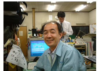
開発者の一人 情報システム本部 高浜次長