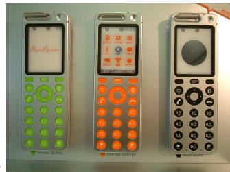
新発売のタルビー