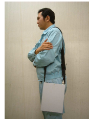
肩にかけると こんな感じです