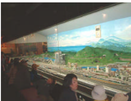
鉄道模型パノラマ運転場

約70年にわたって子供や鉄道ファンの人 気を集めていました。JR東日本創立20周 年記念事業のメインプロジェクトとして、さい たま市大成地区(大宮、北区)に移転建設され るそうです。(07年度)