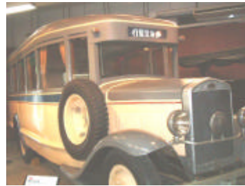
国鉄バス 第1号 (写真 左)明 治の客車

(写真右)のよう に実際に乗って 大人も子供も楽 しめる乗り物が たくさんあります。