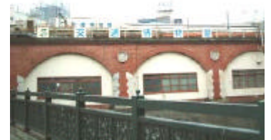
万世橋の上から見た交通博物館