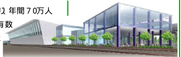
鉄道博物館完成予想図