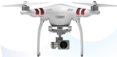
Phantom 3 Standard