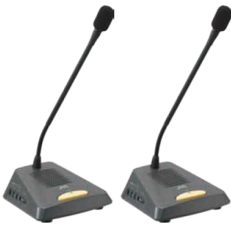
カウンターマイク WT-MC60(特型仕様) ×2