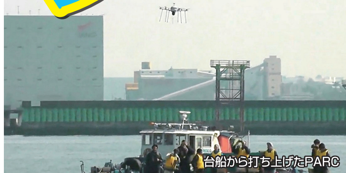
台船から打ち上げたPARC

有線ドローン「PARC」は、2月に都内で開かれたマラソン大会にて、警視庁様からの要請で東京湾沿岸部から飛行し、ゴール付近を監視しました。