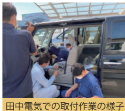
田中電気での取付作業の様子

2022年1月頃、スマホの見積もり依頼をきっかけに田中電気さんを知りました。スローガンの「電波の可能性に挑戦する」というワードとIDOMの社名の由来「挑む」が、同じマインドでシンパシーを感じました。この事業を始めて、約1年半ほどで自社ローン専門道を25店舗に拡大しています。