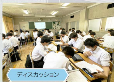
ディスカッション