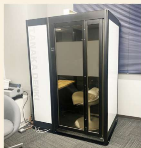
ウェブ会議用のボックス↑ 田中電気のロゴ入り！ 狭くて静かでもここも落ち着く…