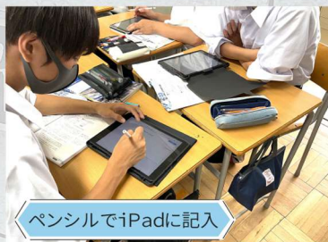
ペンシルでiPadに記入