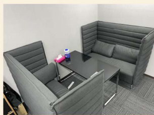
↑打ち合わせスペース