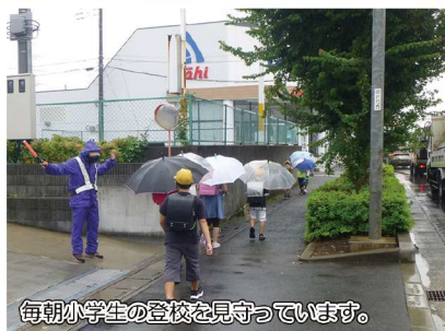
毎朝小学生の登校を見守っています。