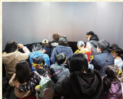
「防災4Dシアター」は(株)理経様・(株)ピー・ピーシステムズ様との共同プロジェクトです