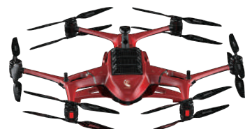
D-HOPE III 720°全方向感知 AI搭載