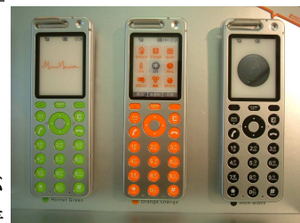
新発売のタルビー