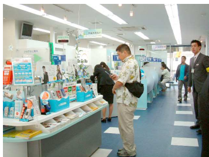
1F正面の広々としたディスプレイ