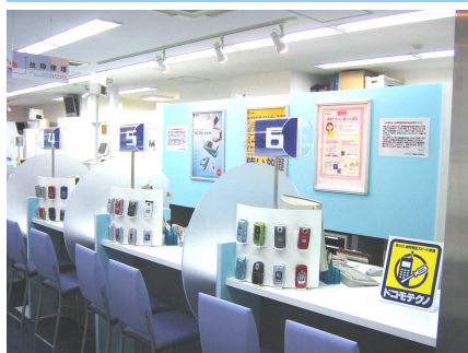
すっきりとお洒落なカウンター