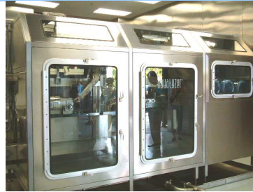
更にピュアな状態へ