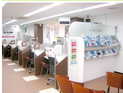
落ち着いたくつろいだ雰囲気です

『ショップとして単に改装というハードにどまらず、接客というソフトのリニューアルにも更に取り組んでいきたい。秋葉原で存在感のあるお店にしようと意気込んでいます。是非一度お越しください。』