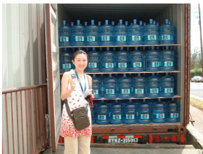
ここから世界に運ばれて行きます

経て、更にピュアな水へと磨かれボトルに詰められて出荷されていきました。特徴は、通常加熱処理で行われる殺菌方法が、ここではオゾン殺菌と紫外線殺菌で処理されることにより、水のおいしさが損なわれないということです。世界でもおいしいお水のランクに入っているハワイウォーターを是非お試しください。