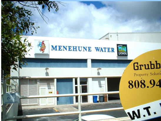
メネフネ社工場正面