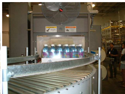
磨かれたお水ができました