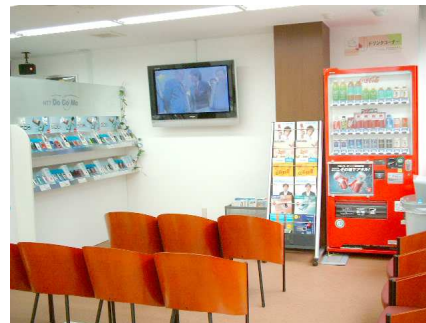
2FでプラズマTVをお楽しみください

新機種は、7月1日には名刺サイズの超小型軽量携帯＜Premini＞プレミニ(69g)、7月中にはお財布代わりになるフェリカ(非接触方式のICカード)方式携帯506icシリーズ(F、P、S0、SH)が登場します。ますます楽しみなドコモです。